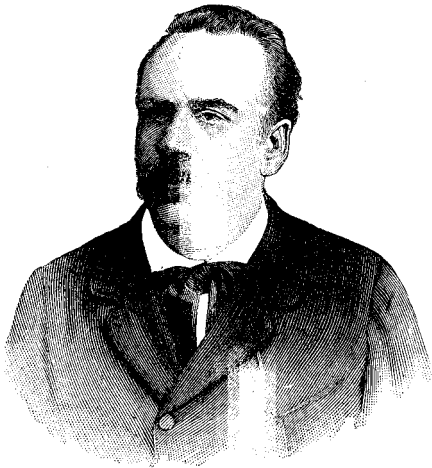
MELLO MORAES FILHO