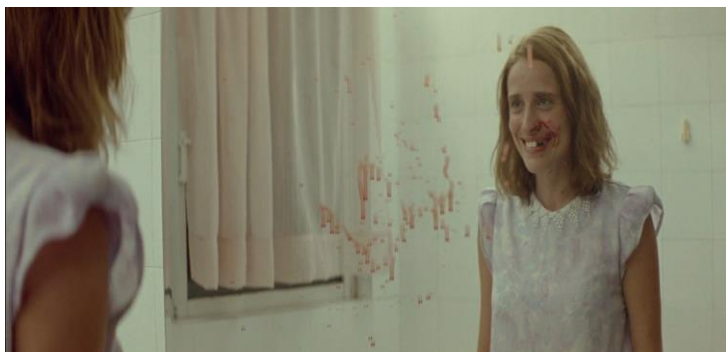
Figura 2. Irmã mais velha após quebrar o dente canino propositalmente para atingir a fase adulta.

As irmãs começam a ter condutas violentas com o irmão, demonstrando que o equilíbrio outrora presente naquela realidade está em declínio. A filha mais velha, mais exposta ao mundo externo através de suas conversas e “trocas” materiais com Christina, é a que se rebela.