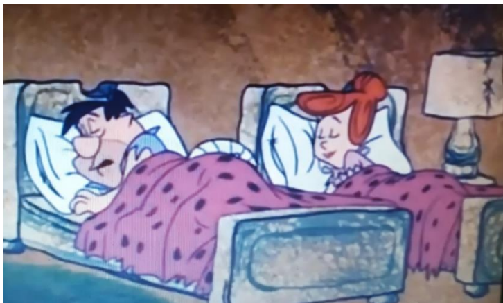
Figura 3. Camas de solteiros para casais, mesmo sendo casados.