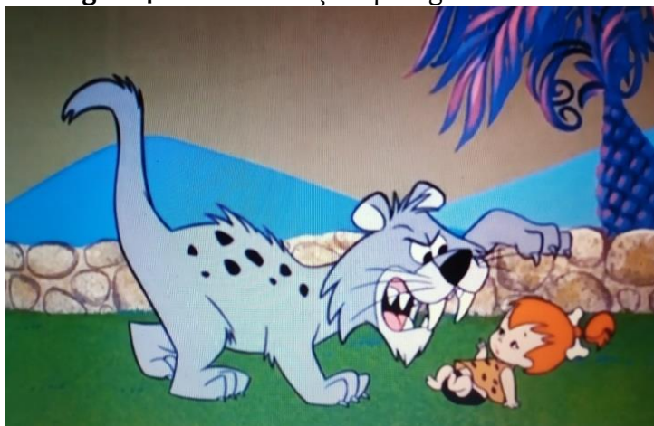
Figura 4. Pedrita ameaçada pelo gato do vizinho