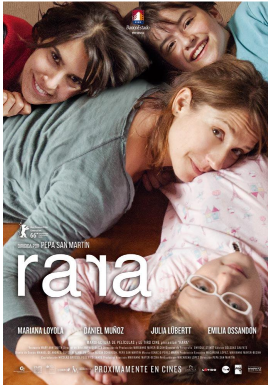
Figura 1. Filha mais nova (de óculos), namorada da mãe (de cima à esquerda), mãe biológica (do meio), e filha mais velha.

É um filme que retrata a forma como as/os filhas/os sofrem a partir do litígio entre mãe e pai e que possibilita refletir sobre o papel da Justiça no Direito de Família, para esses casos. A Figura 1 ilustra as personagens principais da família: a mãe biológica, a namorada e as duas filhas do primeiro casamento.