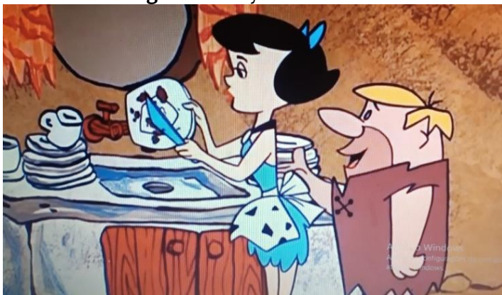
Figura 2. Betty dona de casa