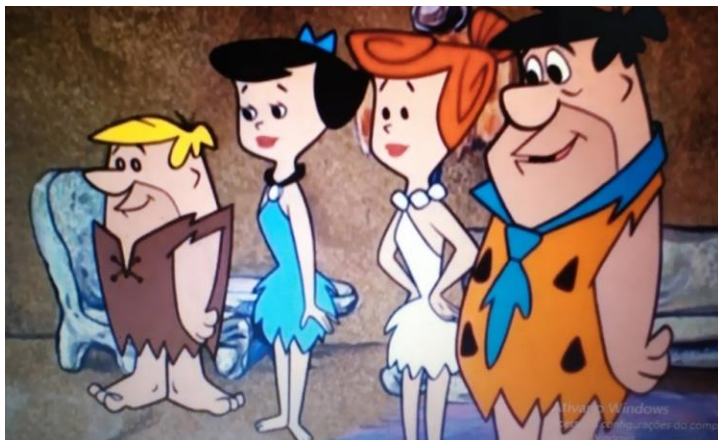
Figura 1. Barney, Betty, Wilma e Fred