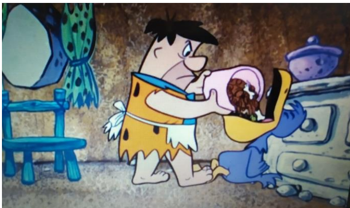
Figura 6. Fred em atividades domésticas