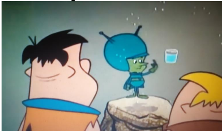
Figura 7. O Grande Gazoo