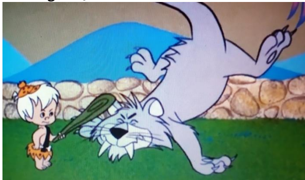
Figura 4. Bam-Bam socorrendo Pedrita