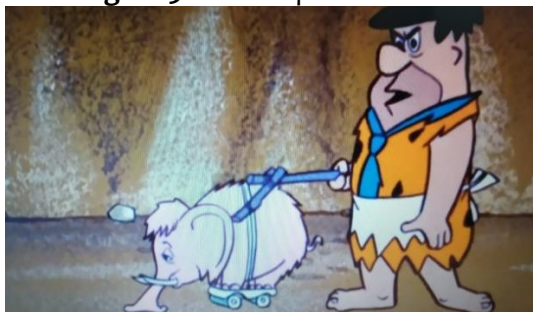
Figura 5. Fred limpando o chão