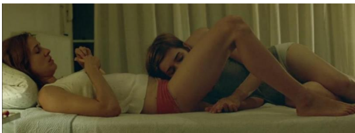
Figura 1. Irmã mais nova oferecendo troca de presentes por “lambidas” à irmã mais velha

No que tange à iniciação sexual dos jovens, observa-se que é realizada de maneira socialmente inadequada, quando Christina, que é paga para fazer sexo com o filho, introduz a vivência da relação sexual através de “troca”, sugerindo à irmã mais velha que lamba sua vulva em troca de uma tiara que brilha. Nessa cena fica claro que a Irmã mais velha nunca havia feito isso, mas se interessa por ganhar um objeto que não tem acesso dentro de seu cárcere. Ela aceita a troca e ganha o objeto desejado, porém em nenhum momento fica claro o entendimento por parte dela de que o ato é sexual.