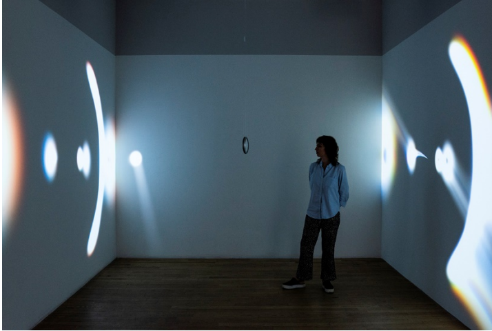
Semioptics for Spinoza (2012), de Rafael Lozano-Hemmer.