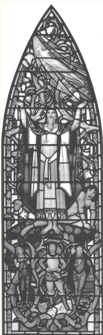
Shakespeare Window, Southwark Cathedral, London, UK. Christopher Webb, Abril 1954. Na parte superior estão representados Próspero, Caliban e Ariel; na parte inferior, as três idades do homem, conforme o discurso de Jaques em As you like it (Do jeito que você gosta).