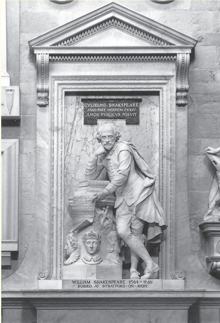
Memorial a William Shakespeare, Poets Corner, Westminster Abbey, London, UK. Mármore branco, Peter Scheemakers, 1741.