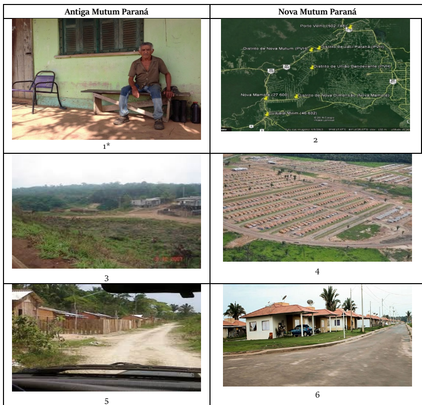
FIGURA 1: Imagens comparativas entre a Velha e a Nova Mutum Paraná.

O mosaico de fotos que formam a Figura 1, a seguir, confronta as diferenças entre a Velha e a Nova Mutum; por outro lado, prova, também, que o fator material não prevalece sobre o fator humano, e, por isso, as pessoas, seus saberes e experiências têm que ser levadas em conta em quaisquer projetos que as atinjam.