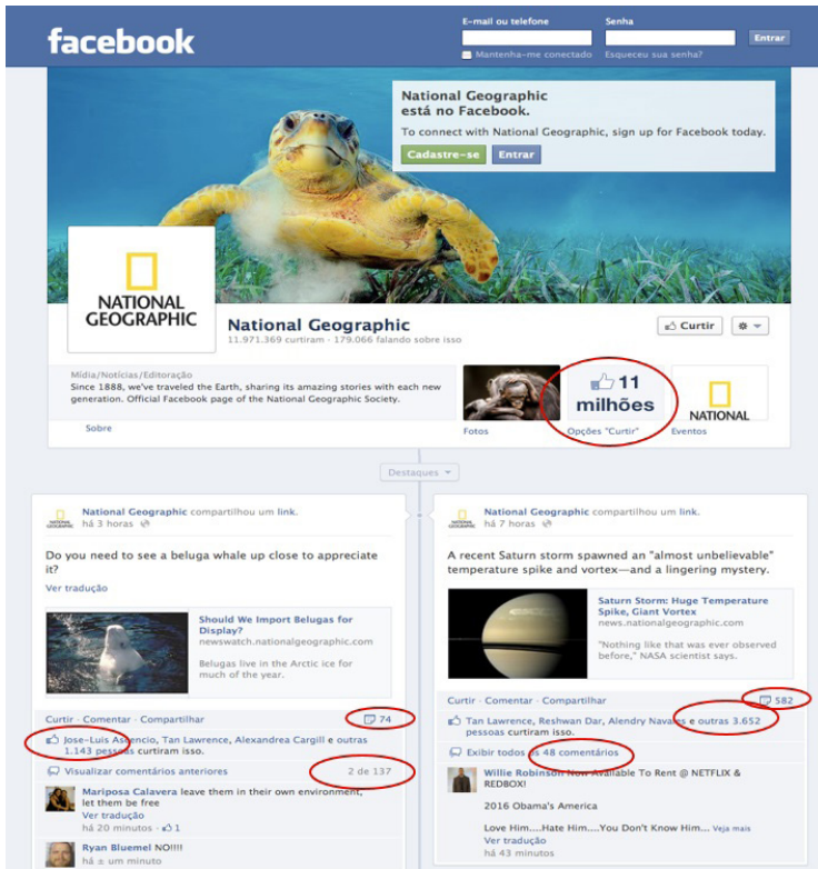
Fonte: Página do National Geographic no Facebook, outubro de 2012.