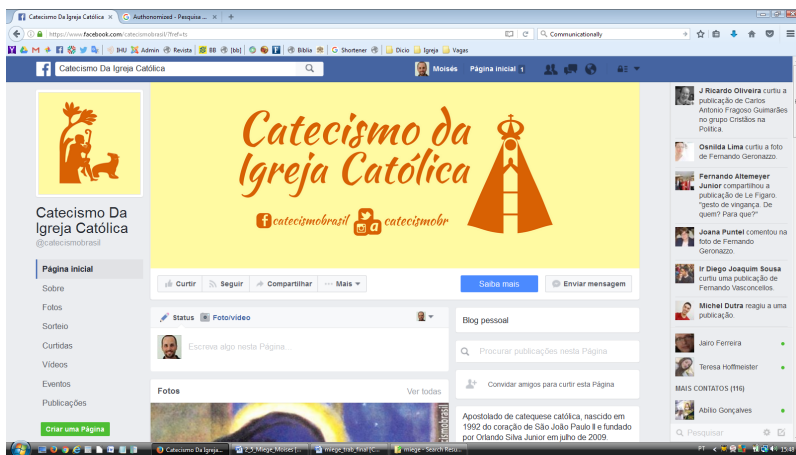
Figura 1 - Página “Catecismo da Igreja Católica” no Facebook