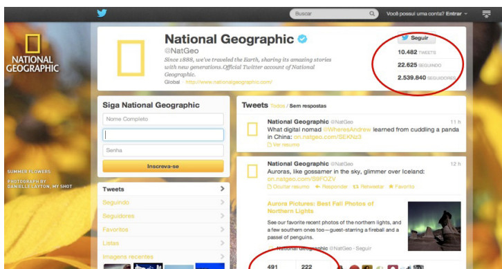
Figura 2 - Interação dos leitores da National Geographic no Twitter