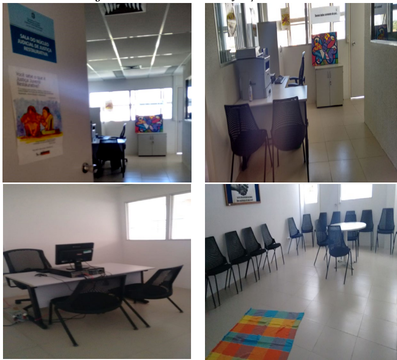
Figura 1: Fotos das salas do Núcleo de Justiça Restaurativa.