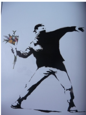
Figura 1: Love is in the air

estes bastante significativos para pensarmos a questão do grafite por se tratar, assim como a fotografia, de uma materialidade visual.