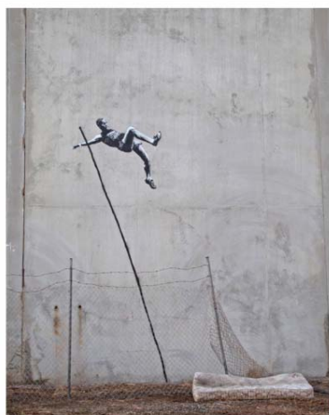
SD3: Grafites de Banksy

O segundo grafite da sequência discursiva traz a imagem de um “atleta” praticando na cidade a modalidade salto com vara. O salto com vara é uma modalidade olímpica na qual um atleta procura superar um obstáculo horizontal, colocado a determinada altura, com o auxílio de