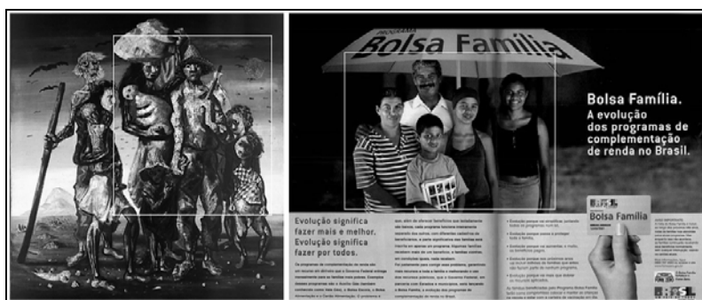
Figura 1 – Relações interdiscursivas e de intericonicidade entre o quadro Retirantes e a “Propaganda do Bolsa Família”.

No que se refere ao aspecto imagético, do ponto de vista de uma leitura que mobiliza relações interdiscursivas e de intericonicidade, a disposição dos modelos na propaganda do “Programa Bolsa Família” (REVISTA VEJA, 2003b) faz alusão à conhecida obra de Cândido Portinari, Retirantes (PORTINARI, 1944), conforme figura 1.