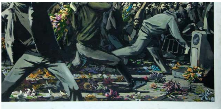
Figura 3: Detalhe da obra de Banksy

No quadro, figura 3 6 , o que está “exposto na pintura” toma espaço no espaço, ao simular um efeito tridimensional, como mostra a sequência discursiva de número 2 7 . Os grafites de Banksy afetam o olhar ao mesmo tempo em que quebram o logicamente estabilizado, os grafites têm um efeito de quebra de sentidos.