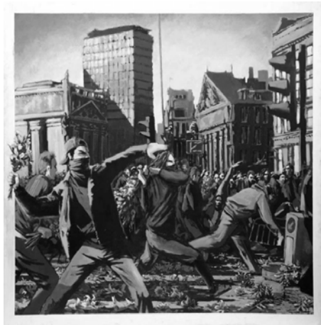
Figura 2: Flower Power , de Banksy

No artigo O enlace entre o pictórico, o político e o textual , Indursky (2011, p. 2), apresenta procedimentos de análise do visual a partir da obra A Câmara Clara : nota sobre a fotografia, de Roland Barthes. No referido texto, Indursky analisa as definições de Studium e Punctum , de Barthes: