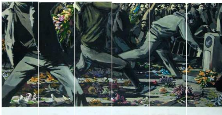
SD2: Efeito Tridimensional

Nessa obra vemos, em primeiro plano, três pessoas. Porém, se olharmos mais atentamente, percebemos que a sequência simula o movimento de um corpo, um corpo em movimento. O arremessador de flores ganha vida em conjunto com outros manifestantes, sugerindo um efeito de união pela força. Um movimento que intervém no espaço da pintura, “o trabalho dos sentidos praticando a ligação corpo/espaço/movimento” (ORLANDI, p. 94, 2012).