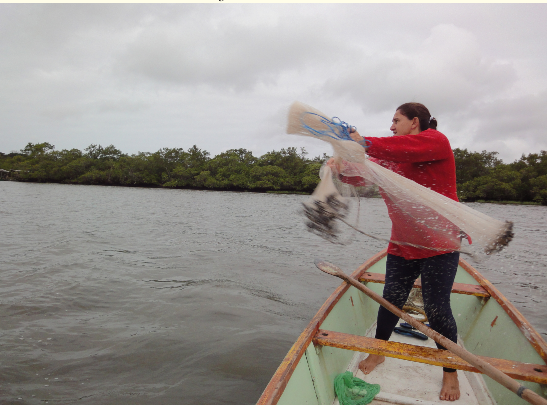
Figura 4 – Tarrafeando