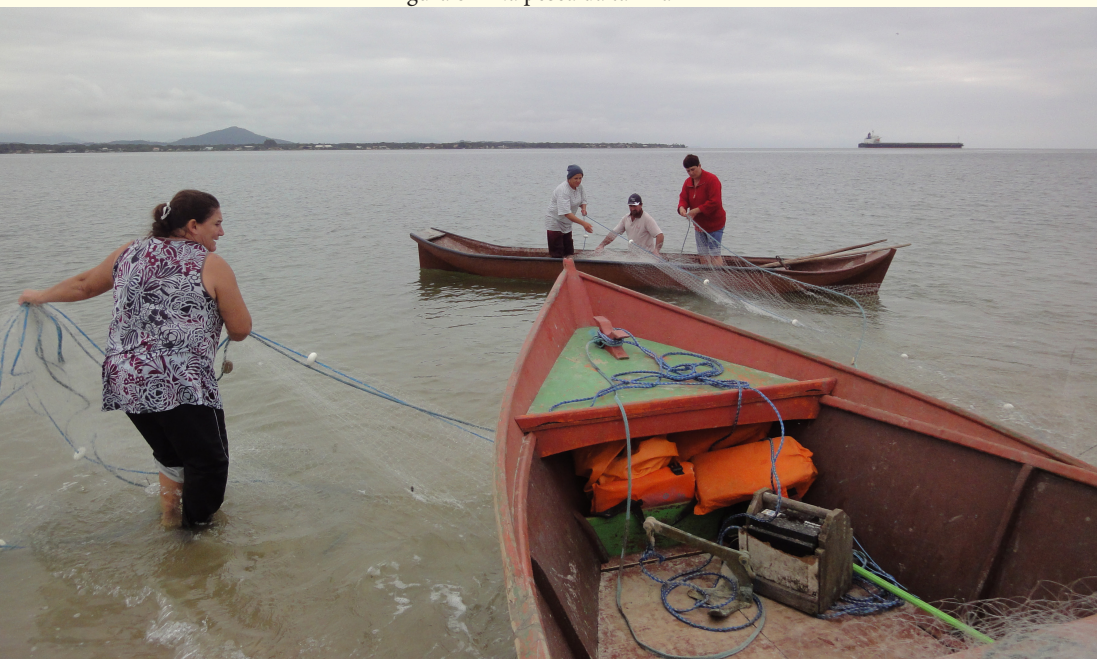
Figura 8 – Na pesca da tainha