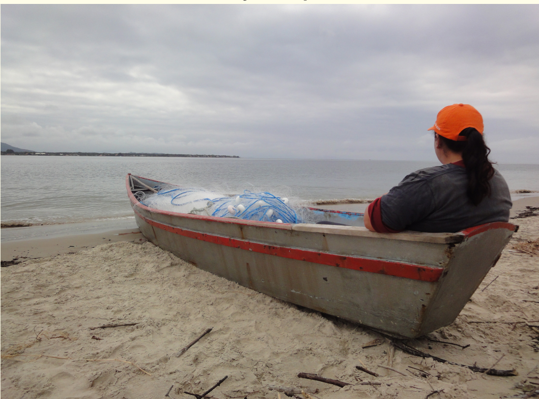
Figura 6 – À espera