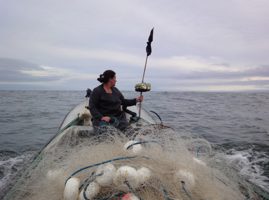
Figura 1 – Saindo para o mar