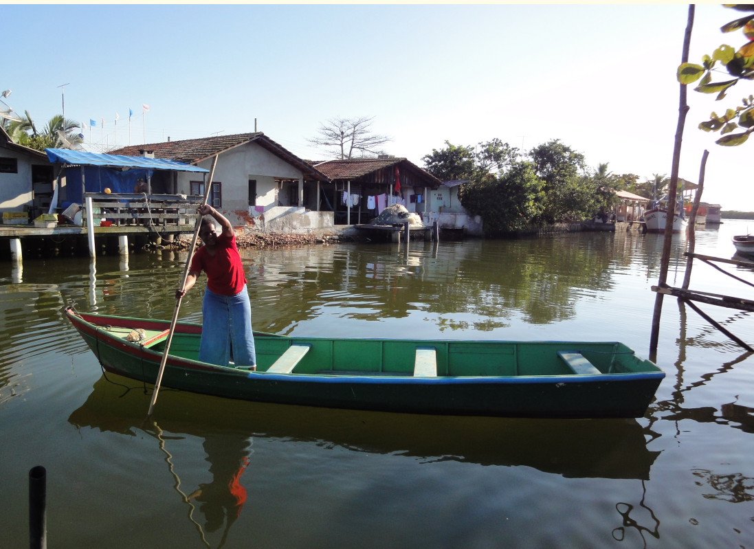
Figura 12 – Chegando ao porto