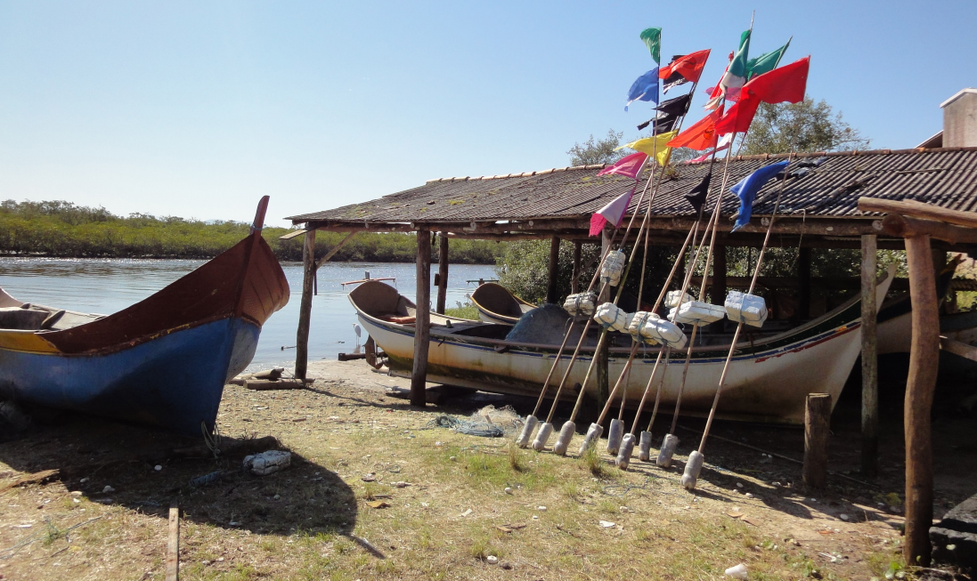
Figura 26 – Bandeiras multicoloridas I