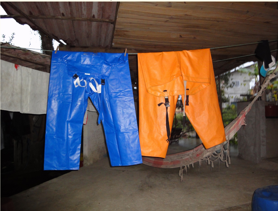
Figura 18 – Macacões de oleado