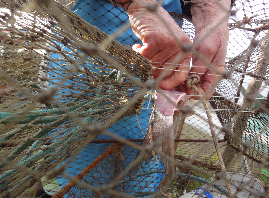
Figura 21 – Mãos na pesca II