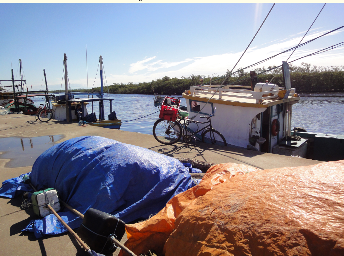
Figura 28 – Bicicletas