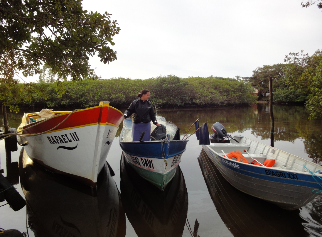
Figura 9 – Um porto seguro