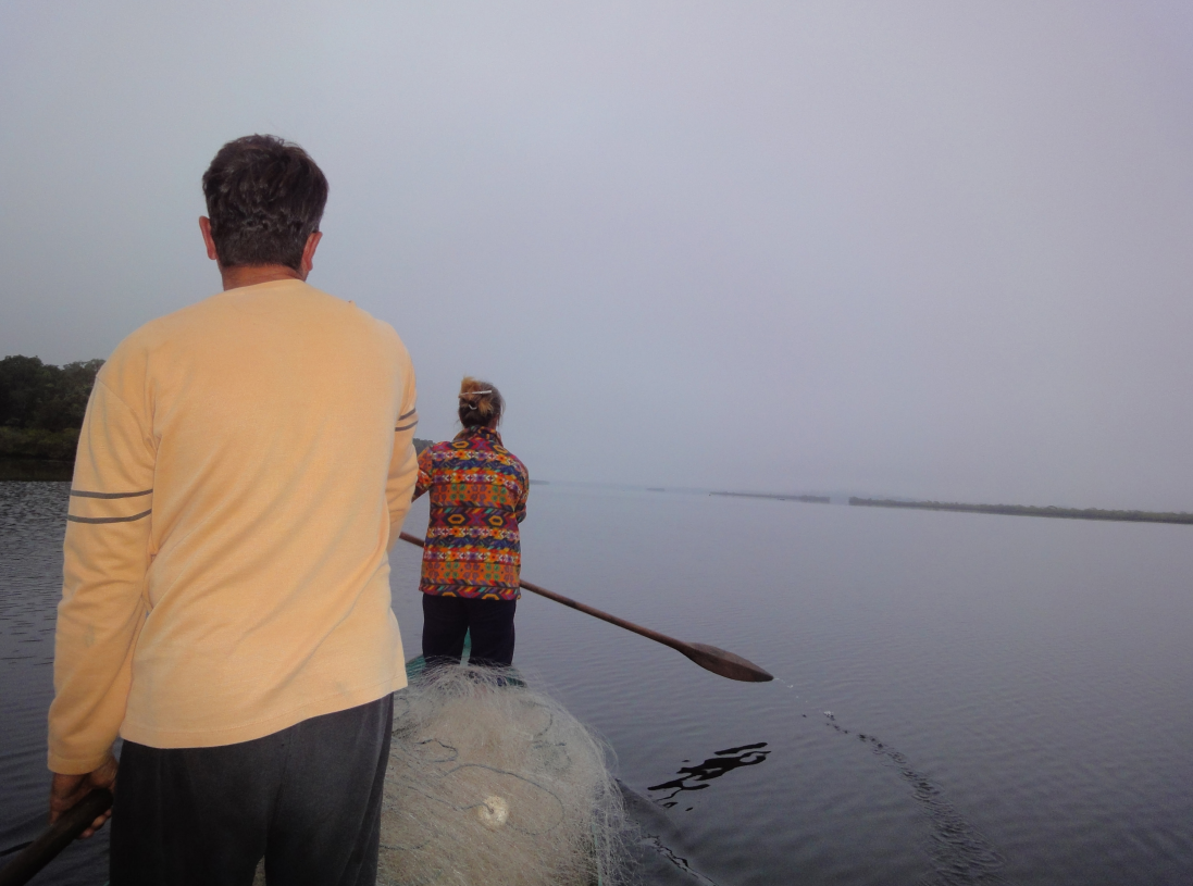
Figura 11 – Sincronia em terra, sincronia no mar