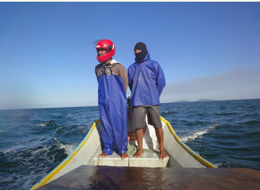
Figura 14 – Camaradas