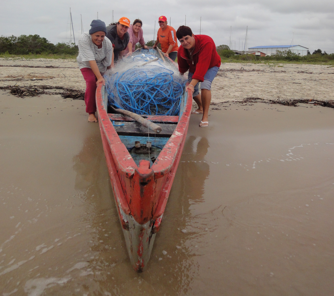
Figura 7 – Mulheres ao mar