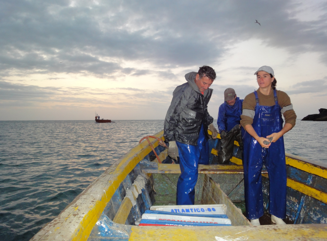
Figura 3 – Indumentária no mar