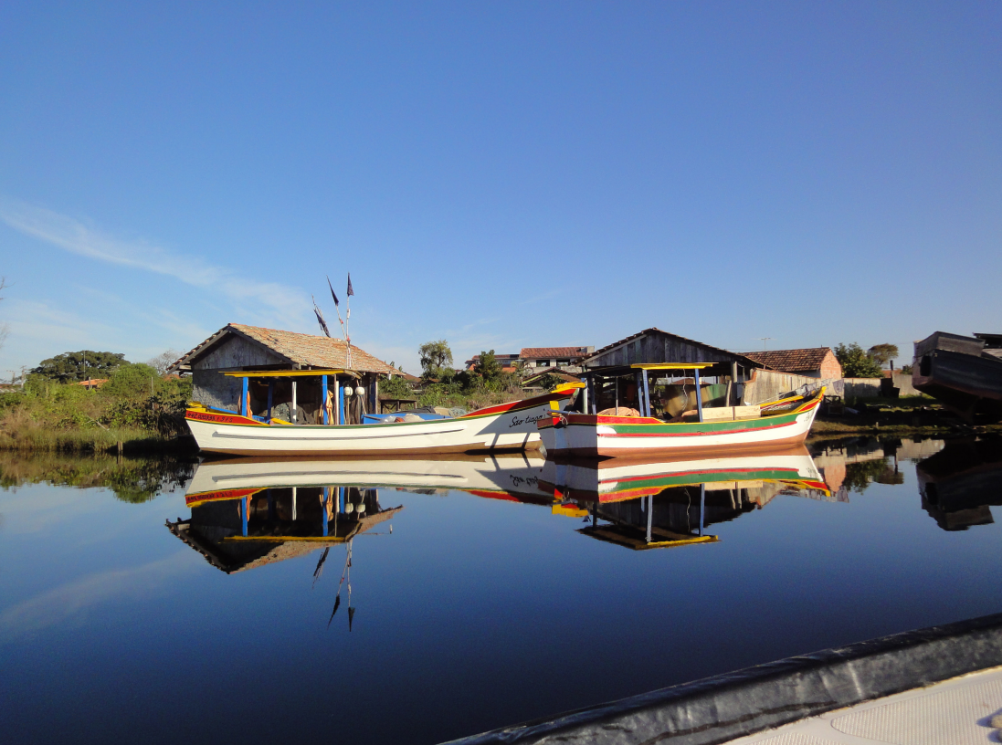
Figura 31 – A água como espelho