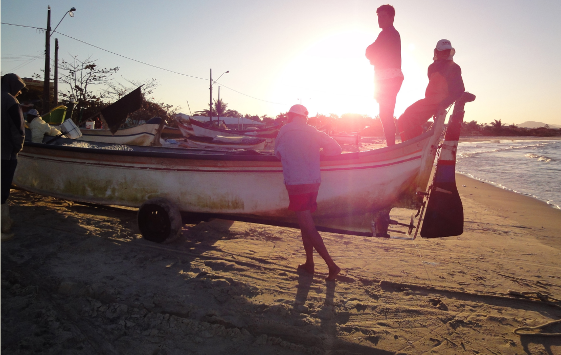
Figura 13 – Fim de tarde, fim de pesca