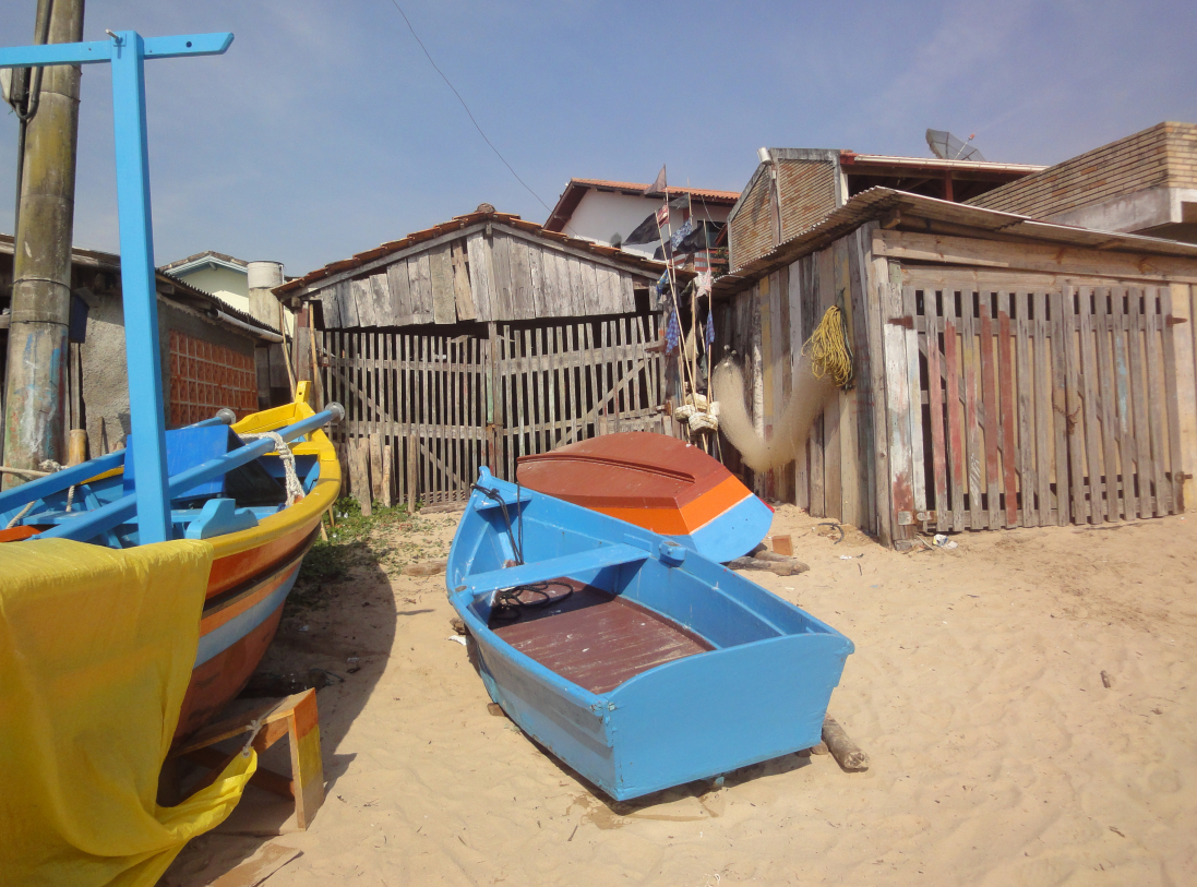
Figura 23 – Ranchos e canoas