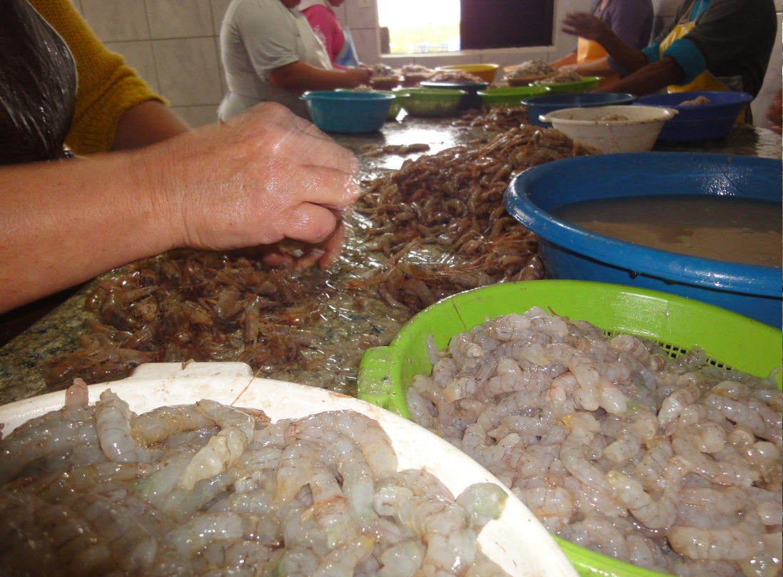
Figura 19 – Mãos no descasque de camarão