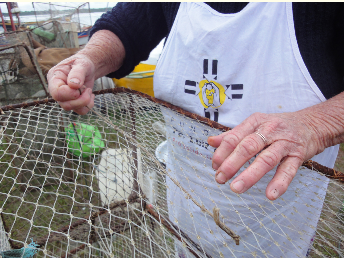
Figura 20 – Mãos na pesca I