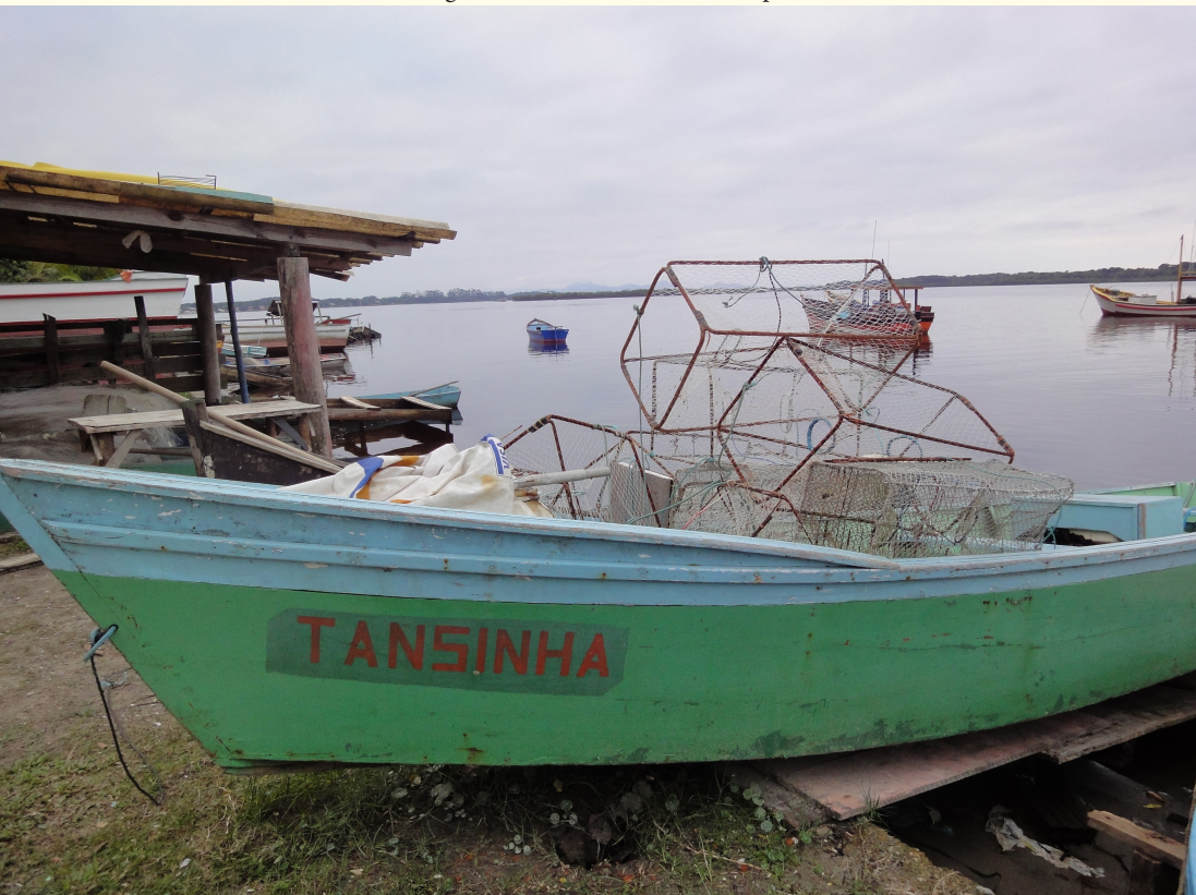
Figura 22 – A canoa Tansinha espera