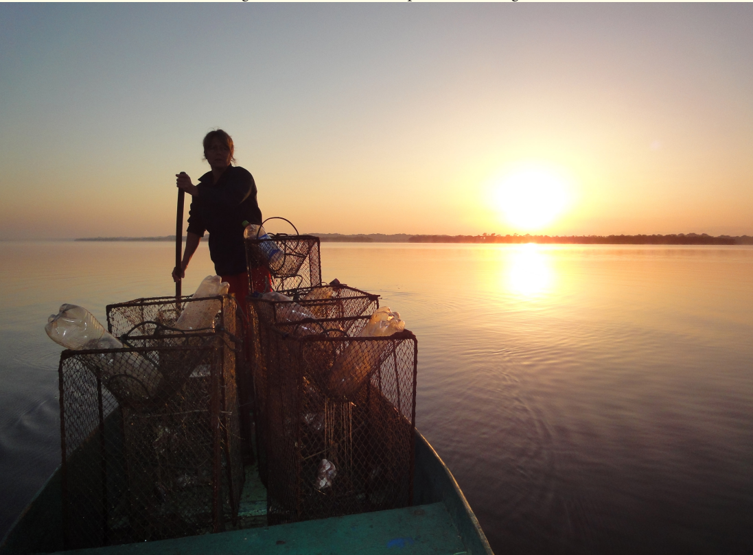
Figura 10 – Amanhecer na pesca de siri de gaiola