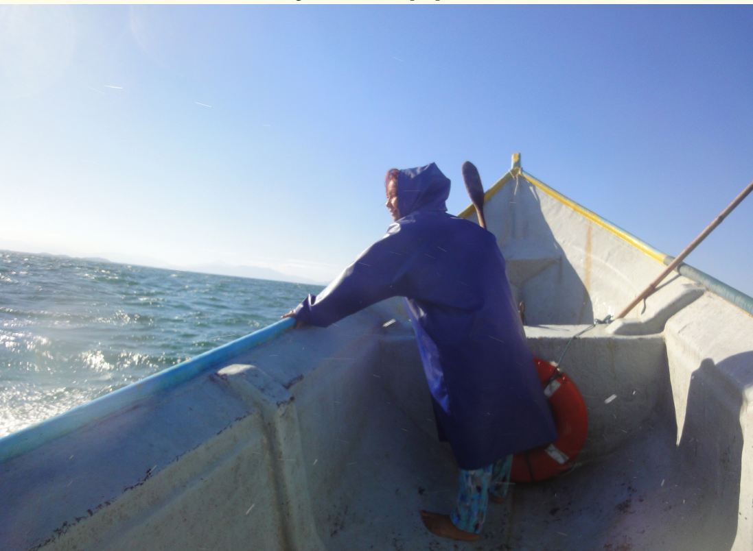
Figura 2 – Esse tempo que muda