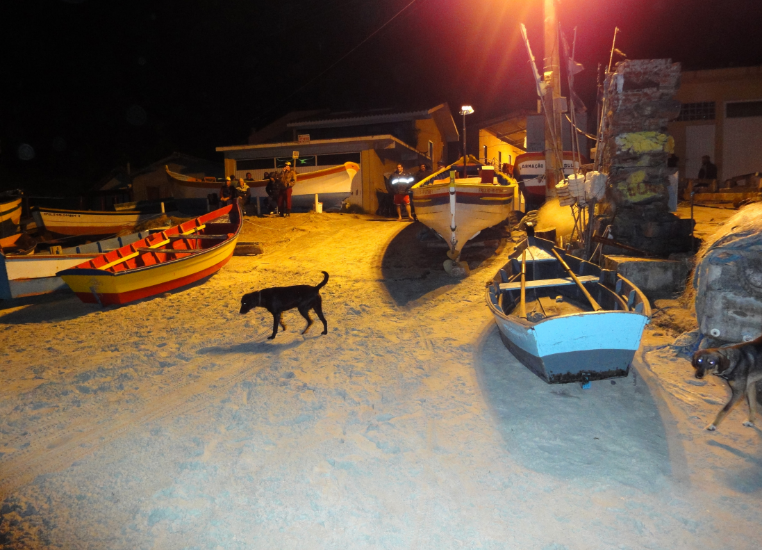
Figura 15 – Esperando para sair ao mar