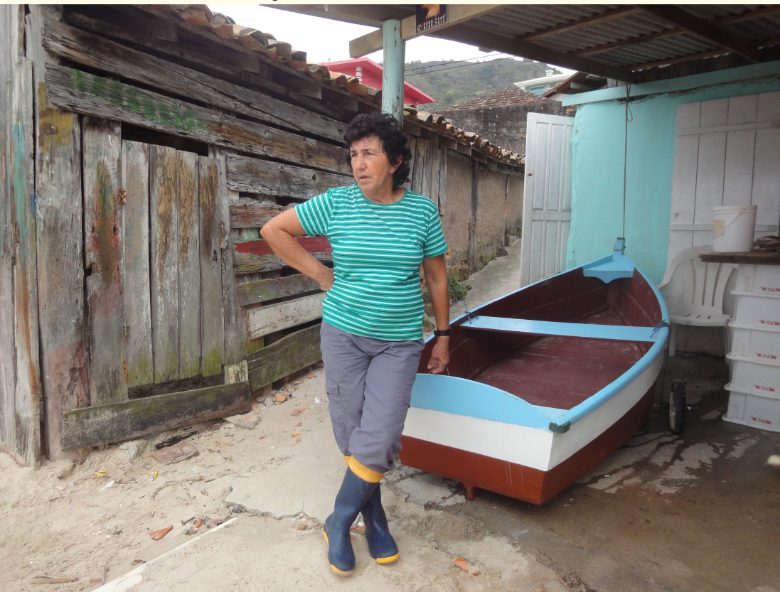
Figura 16 – Indumentária em terra