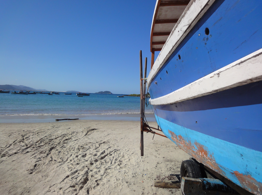
Figura 29 – A embarcação e o mar