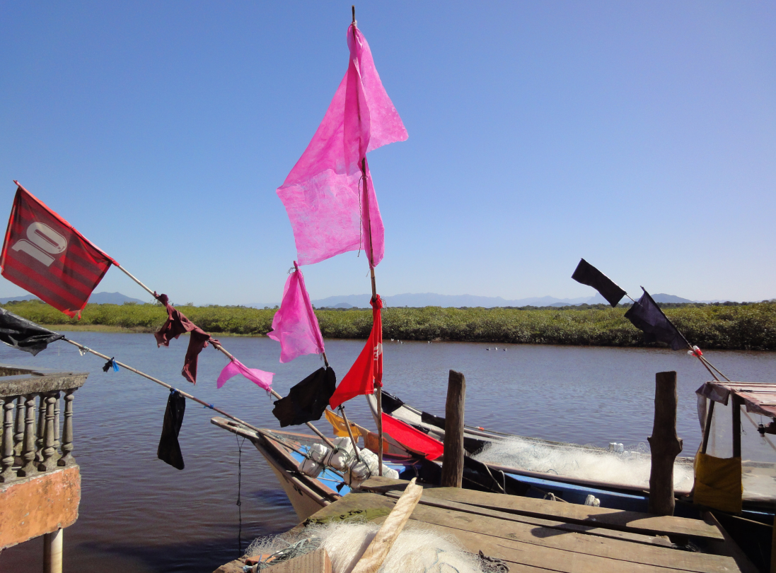
Figura 27 – Bandeiras multicoloridas II