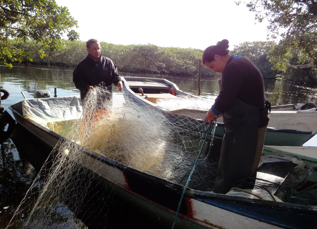
Figura 17 – Enredando a rede