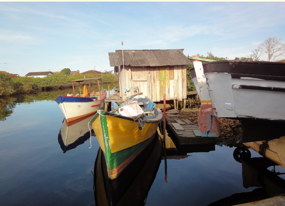
Figura 32 – Embarcações em descanso