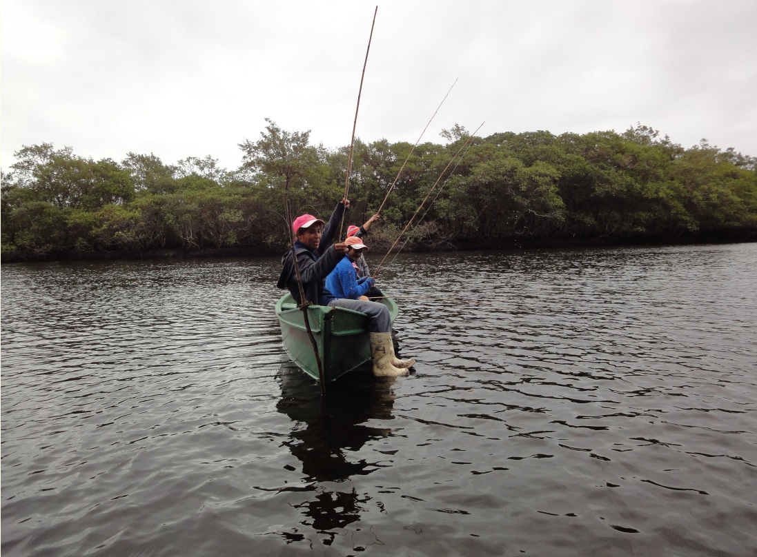
Figura 5 – Pescando baiacu