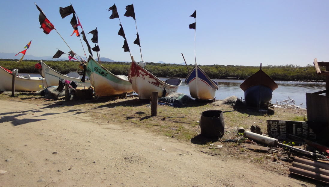
Figura 25 – Bandeiras e botes