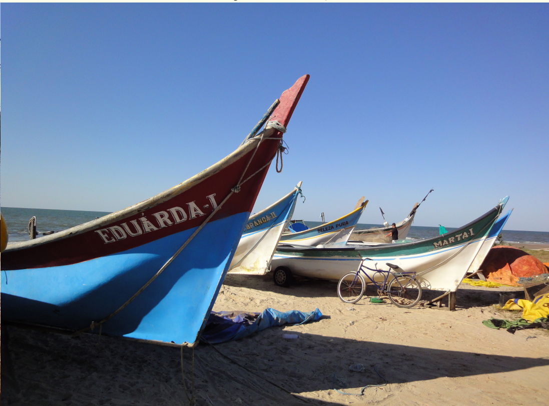
Figura 30 – Embarcações