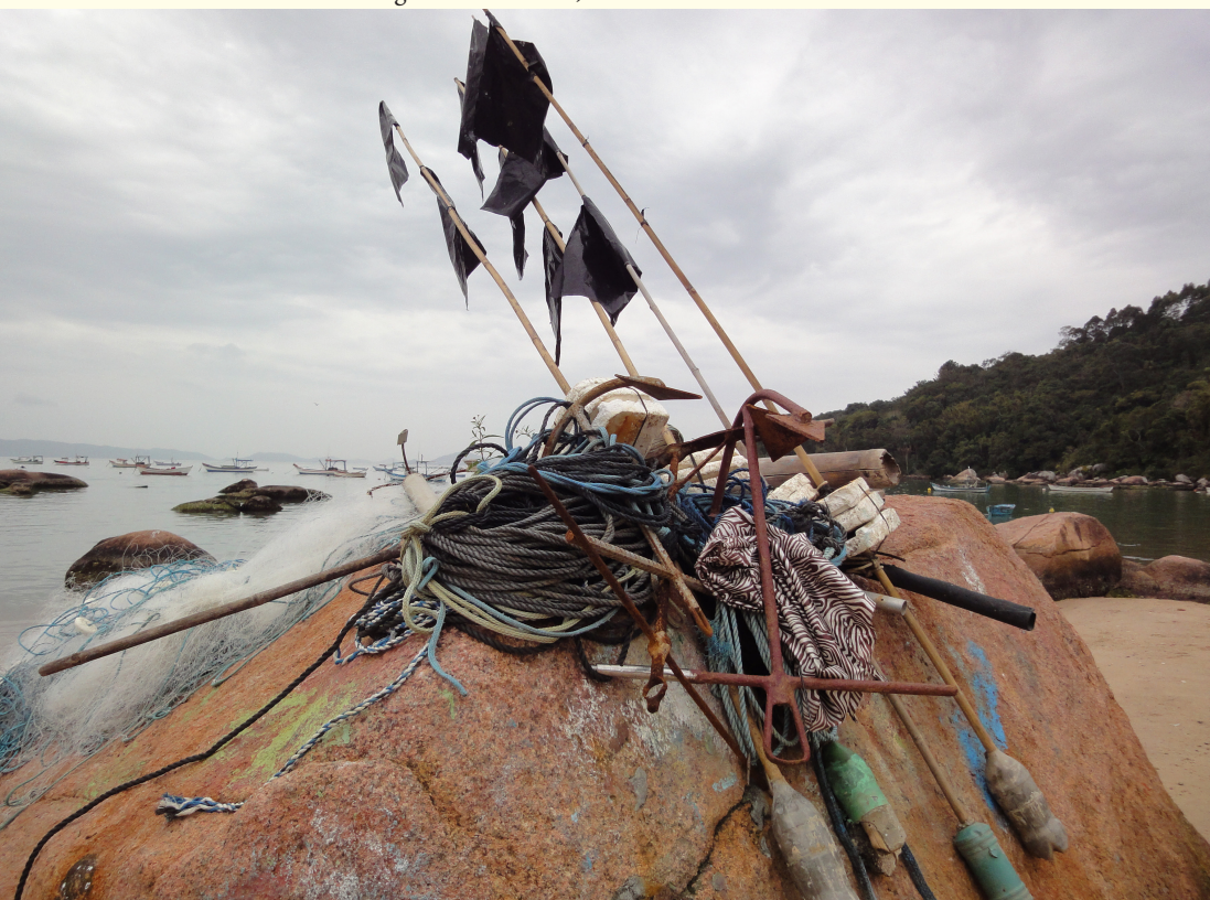
Figura 24 – Cordas, bandeiras e âncoras