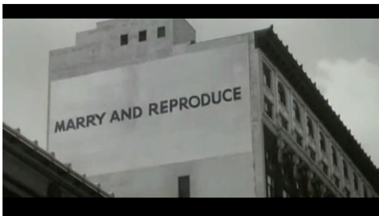
Figura nº 1 (00:31:34)

É de salientar o estatuto actancial deste personagem: ele já desconfia de algo e, portanto, protagoniza um programa narrativo de suspeita. Do ponto de vista semiótico, uma TC caracteriza-se fundamentalmente nesse aspecto: ao invés do que sucede nas distopias, que são registos de revelação, aquelas são textualidades de suspeição e de desmistificação. É por isso que os heróis vigiam tudo o que seja significativo dos seus pré-conceitos (suspeitas). Em contrapartida a esta abordagem, encontramos a opção de Francis Ford Coppola (“The Conversation”) e de John Carpenter (“They Live”) no modo como gerem o estatuto dos sujeitos que formulam as TCs e a sua respectiva tematização. O que é encenado nestes filmes é a sua transformação à medida que se confrontam com eventos misteriosos que tentam compreender. Num caso, um casal que se supõe protagonizar um caso amoroso (“The Conversation”), no outro uma série de raptos, de violência policial conjugada com cultos religiosos e estranhas transmissões televisivas (“They Live”). Subjacente às emissões de televisão, aos anúncios de publicidade, à promoção nos rótulos de produtos está uma indústria da endoutrinação e da lavagem cerebral (figura nº 1).