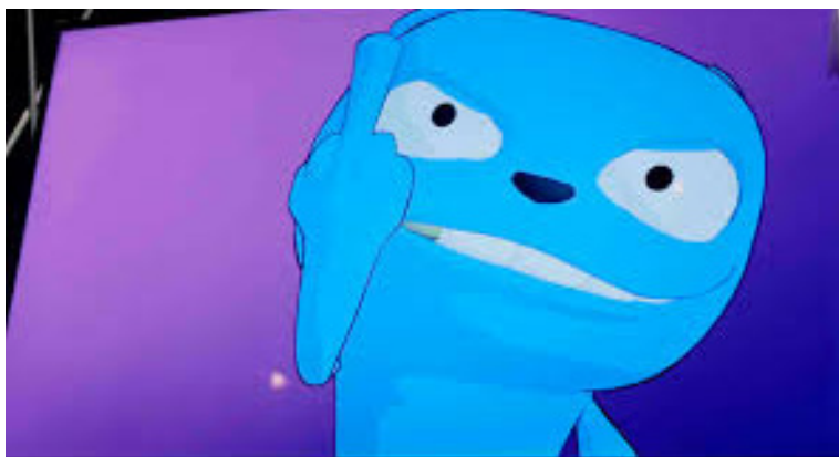
Black Mirror: Waldo Moment, 3rd, 2nd season

Como todo o peso dessa propaganda é promover os meios, a propaganda em si torna-se o conteúdo final. A. O desejo de vigiar, de denunciar é encorajado e é satisfeito. As histórias de escândalo, na sua maioria fictícias, particularmente de excessos e atrocidades sexuais, são constantemente contadas; a indignação com a imundície, a corrupção e a crueldade são olhadas por Adorno (1946) como uma racionalização muito fina e propositadamente transparente do prazer que essas histórias transmitem ao ouvinte.