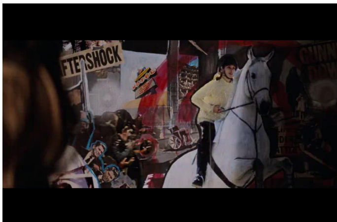
Figura nº 3