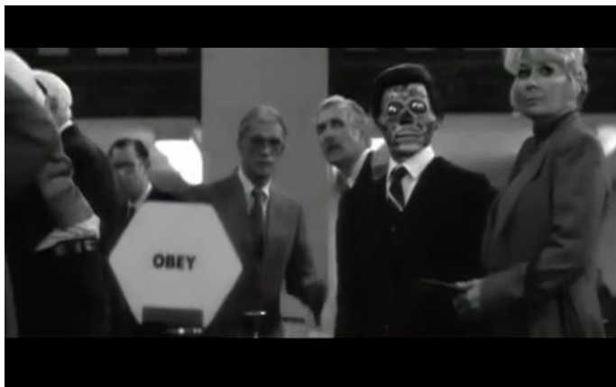
Figura nº 4 (00:39:35)

Já em “Conspiracy Theory”, o rival inscrito na categoria do ‘anti-próprio’ encontra-se em Dr Jonas, sujeito dotado de super-poderes explicitados na cena do desaparecimento do seu escritório. O depoimento que efectua a Alice Sutton também é significativo deste perfil de herói do mal: discreto e perverso, inteligente e engenhoso, que domina as técnicas da lavagem cerebral (investigação sobre alucinações, electro-choques, estados vegetativos, experiências com ausência de sensação até à morte).