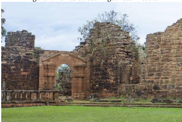
Figura 1. Ruínas de São Miguel das Missões

Declarado Patrimônio Mundial pelo UNESCO, em 1983, o sítio, Ruínas de São Miguel das Missões (Figura 1, 2, 3), juntamente com as ruínas no lado argentino de San Ignacio Miní, Santa Ana, Nossa Senhora de Loreto e Santa María Mayor, é um local visitado por turistas de todo o mundo. Sua construção é datada do século XVIII e faz parte do roteiro internacional Iguassu-Misiones. Com grande importância na cultura gaúcha a coleção de esculturas sacras dos Sete Povos, compõem parte do acervo.