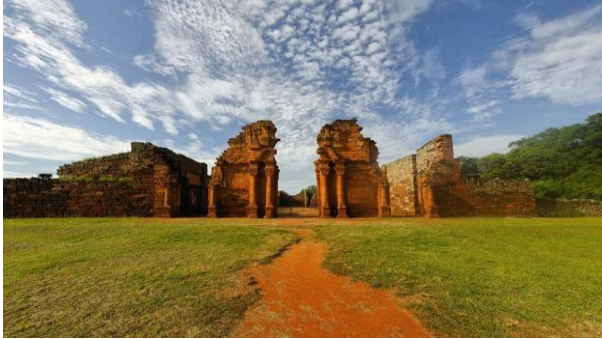
Figura 2: Ruínas de São Miguel das Missões