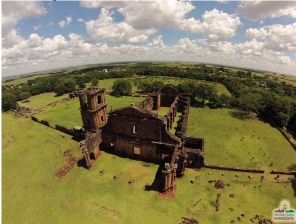
Figura 3. Ruínas de São Miguel das Missões