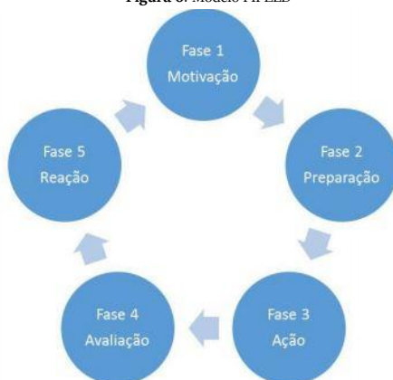
Figura 6: Modelo FIPELD

O modelo FIPELD parte da premissa de que o professor deve tomar partido das TDIC para sua autoformação, mas com foco na aplicação destas na sua prática pedagógica junto a seus estudantes de forma integrada. A FIPELD sugere que os professores compreendam que as TDIC não são apenas ferramentas para se chegar a um meio, mas “processos a serem desenvolvidos” (CASTELLS, 1999, p. 51). Quando se fala em evolução, pensa-se em processo. Portanto, a formação para a literacia digital deve ser evolutiva e processual tendo em vista que o processo de apropriação das tecnologias pelos professores é gradual, sujeita a diferentes variáveis e requer tempo para ser assimilado nas práticas docentes. Não se trata de um curso específico de formação de professores para o uso das tecnologias. A proposta FIPELD corresponde a um modelo referencial que pode ser adaptado para oficinas em grupos de professores de uma escola ou mesmo uma formação maior para uma rede de ensino. O modelo FIPELD é cíclico, portanto, evolutivo e permanente, conforme representado na figura 6.