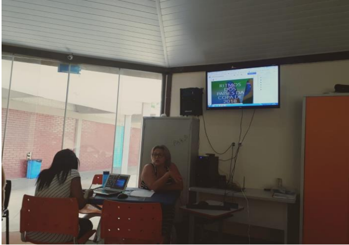
Figura 5 – Participante apresentando a sua Webquest ao grupo