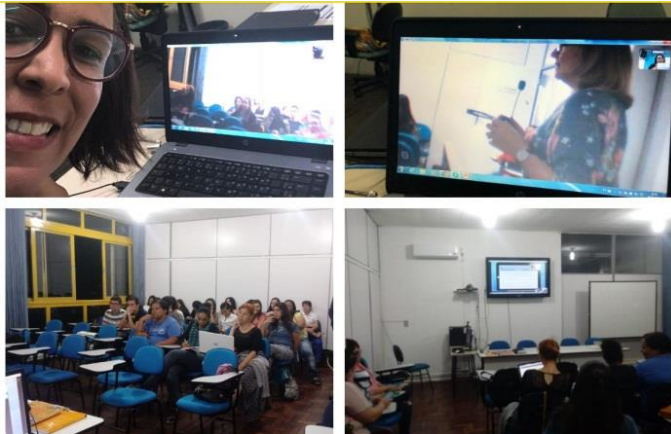
Figura 6 - Oficina do dia 29/10/2018 (via Skype)

A primeira conferência foi realizada dia 29/10/2018 numa sala do polo com uma participação expressiva de estudantes (figura 6).