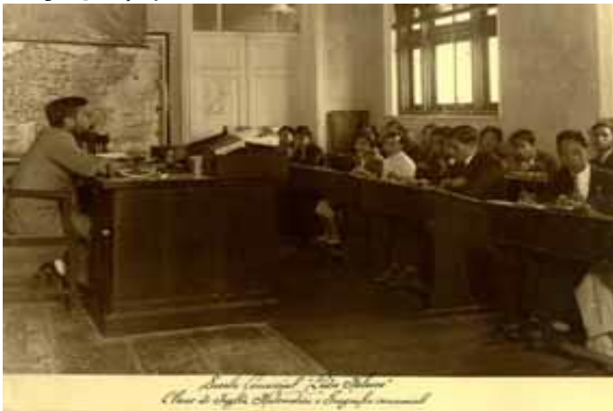
Figura 4 - Disposição do mobiliário escolar de uma sala de aula no início do século XX