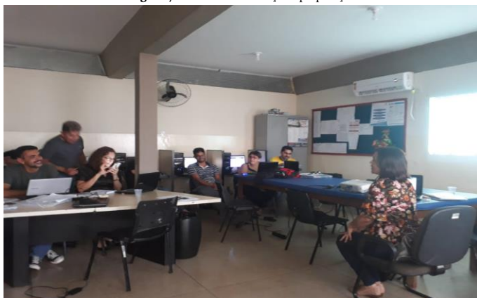
Figura 7 - Oficina de Motivação e preparação

Na primeira oficina, os professores puderam experimentar as tecnologias em duas situações: no papel de estudantes e no papel de professores. Na primeira situação, a formadora simulou que os participantes eram seus estudantes e preparou um game no aplicativo Kaout em que todos foram incentivados a baixar nos seus celulares e participar. O Kahoot é uma plataforma de ensino gratuita que funciona como um gameshow . Os professores criam questionários de múltipla escolha (sempre com 4 opções) e os estudantes participam online, cada um com seu dispositivo (computador, tablet ou celular). O Kahoot classifica os participantes que acertaram mais questões em menos tempo, assim quem participa da atividade sente-se motivado a competir por uma posição melhor, princípio da gamificação da qual os estudantes em geral sentem-se motivados a participar. Os resultados com estes professores foram surpreendentes, eles ficaram muito interessados no aplicativo e em como poderiam usar com seus estudantes.