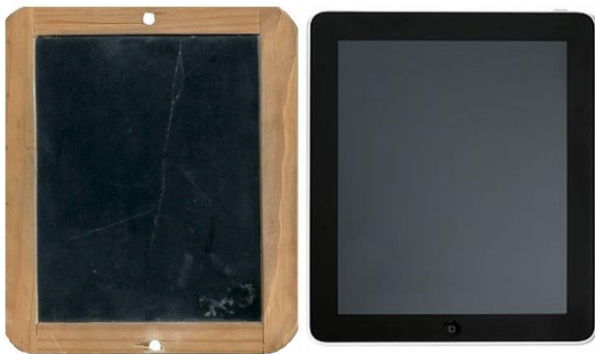
Figura 5 - Analogia do quadro-negro com o tablet