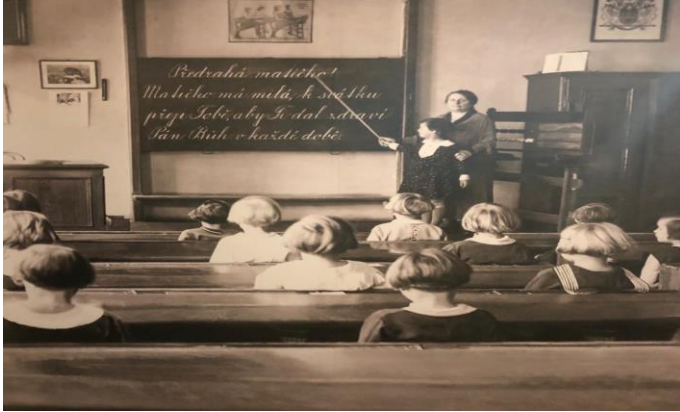
Figura 2 – Sala de aula com suporte do quadro-negro nos anos de 1930.