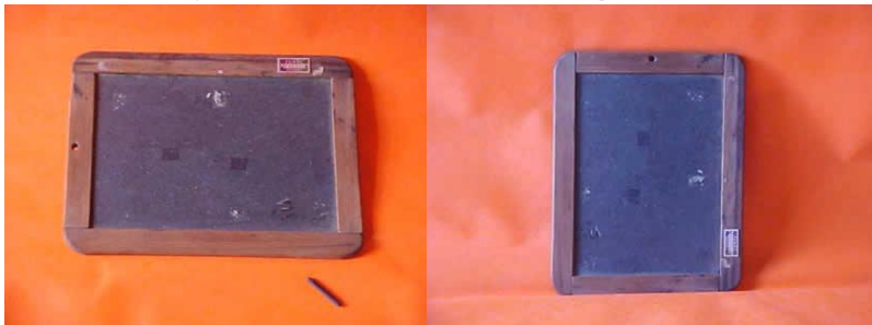
Figura 1 - Lousa de ardósia individual do aluno com lápis de ardósia