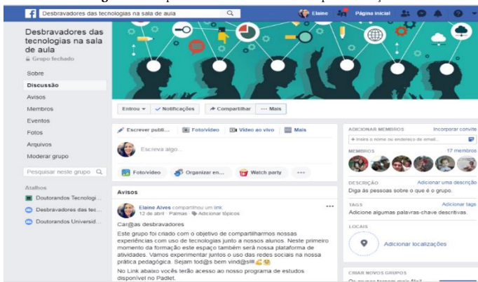
Figura 8 - Grupo fechado criado no Facebook para interação

consideravam interessantes para compartilhar com colegas. Considerando a pesada carga horária de trabalho destes professores, a participação neste grupo foi mínima. No entanto, todos os dias a formadora compartilhava novos recursos, metodologias e ferramentas web voltadas para a tecnologia educacional e observava que os participantes visualizavam as postagens. O objetivo do grupo na rede social foi criar um espaço informal de troca de experiências e cultivar uma cultura de compartilhamento de conteúdos que discuta as tecnologias educativas entre os professores.