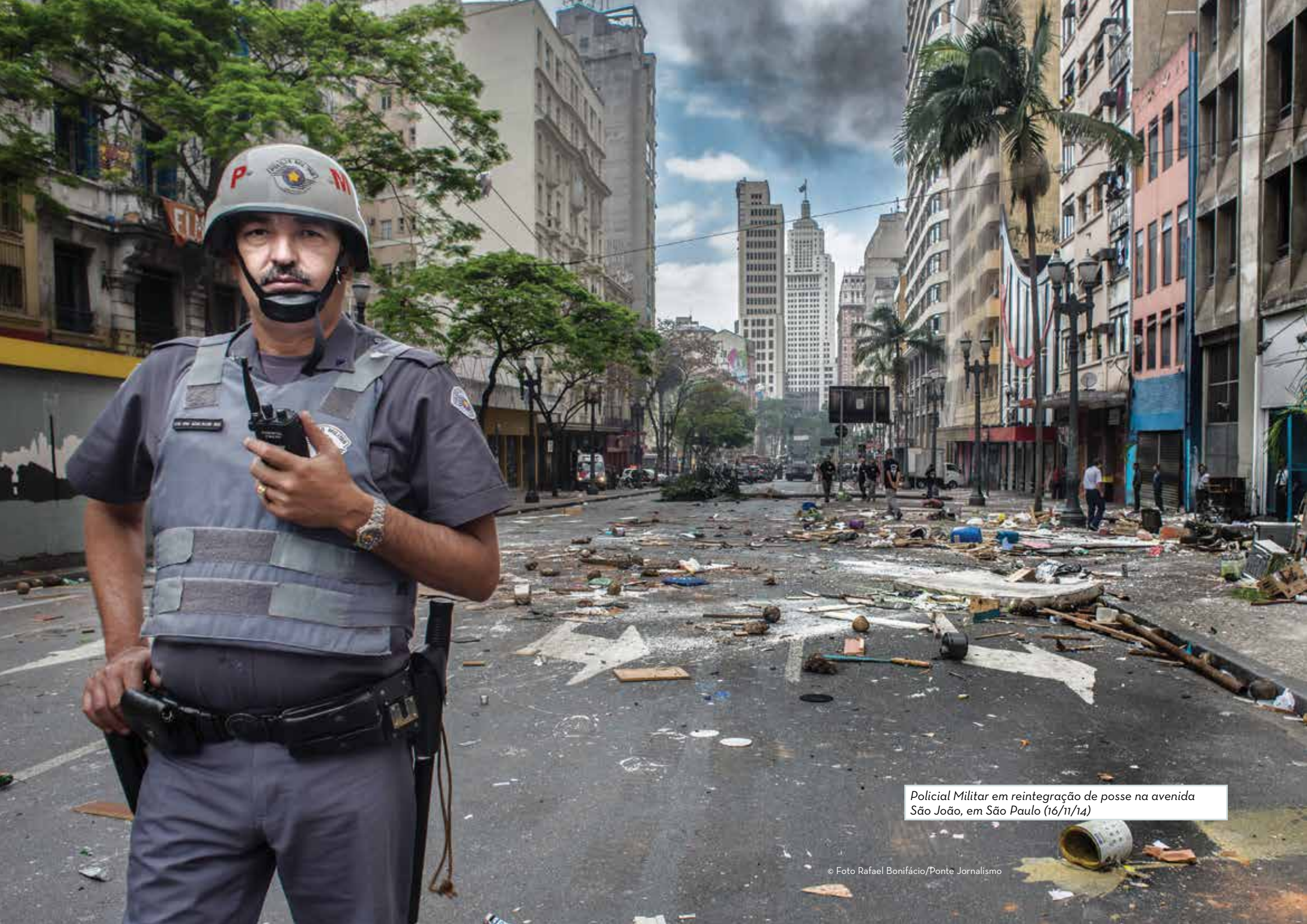
Policial Militar em reintegração de posse na avenida São João, em São Paulo (16/11/14)