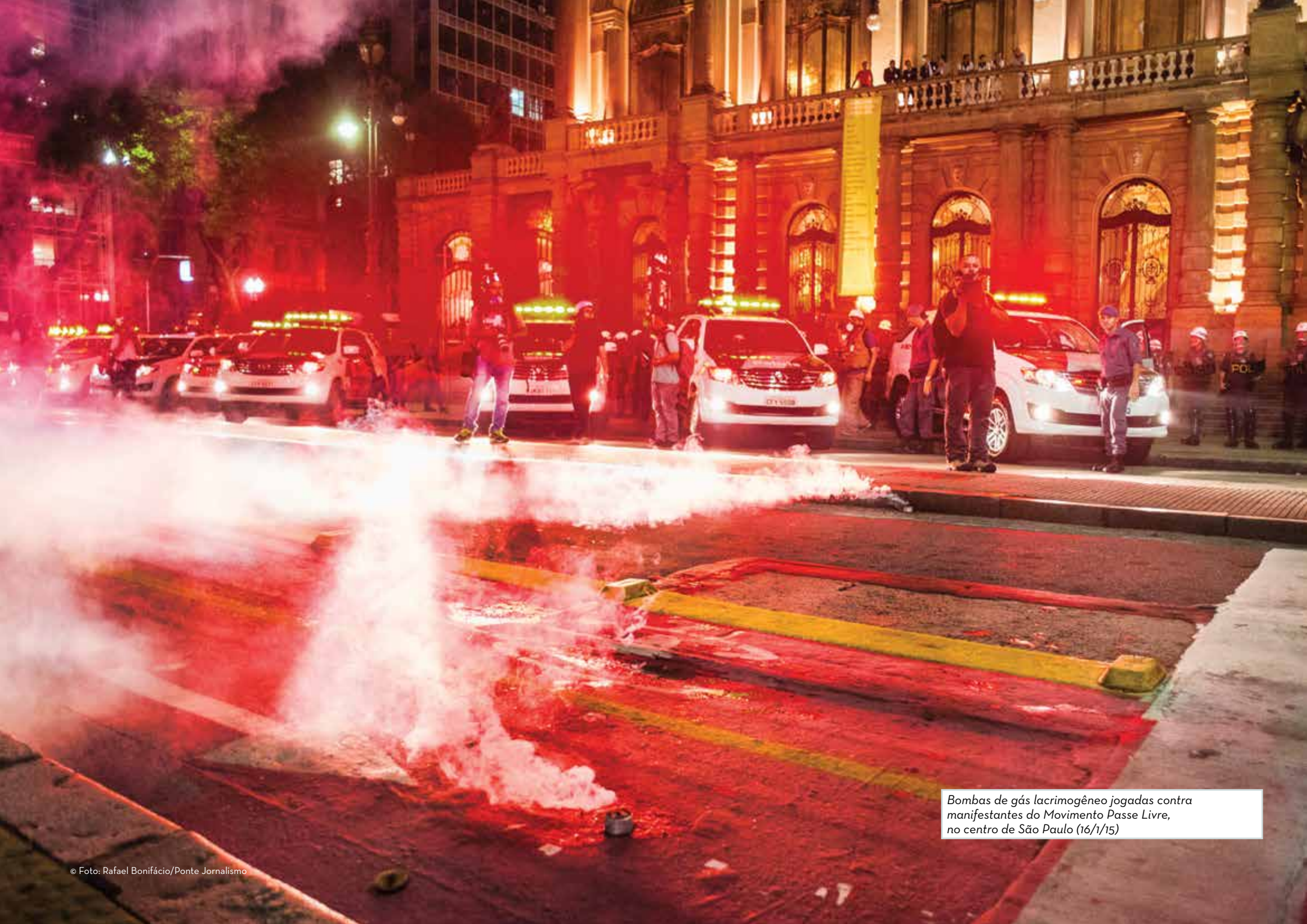
Bombas de gás lacrimogêneo jogadas contra manifestantes do Movimento Passe Livre, no centro de São Paulo (16/1/15)